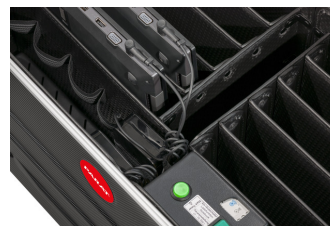
- Ladeinheit (Switch On /Off)